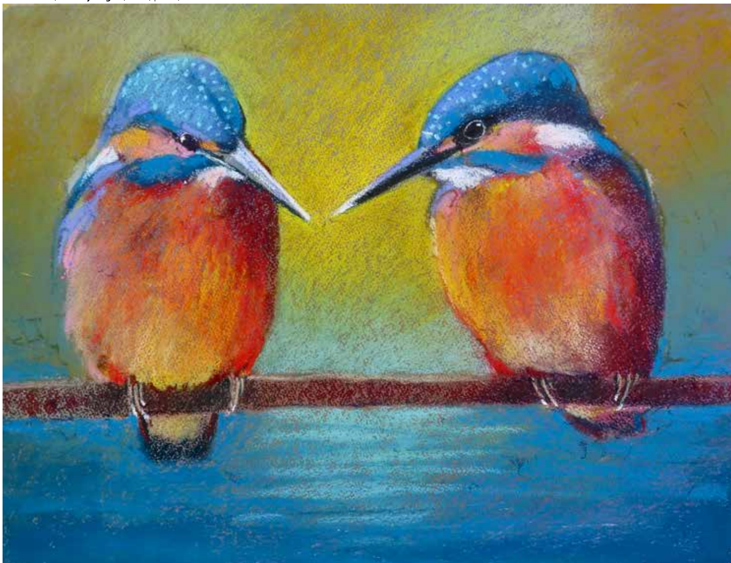
Loes Botman, Twee ijsvogels , 2024, pastel, 49 x 36 cm

Door overal nog een laag aan te brengen, worden de kleuren krachtiger en krijgt het werk veel meer zeggingskracht. Wat lichte blauwe horizontale banen om het water aan te geven. De verfijnde dunne lijnen bij de snavel en de oogjes zijn getekend met een Conté à Paris-krijtje. Wees wel voorzichtig met al die prachtige lichtjes op de vogelkopjes, dat kan snel te veel worden. Het oranje op de borstjes van de vogels brengt het geel en het rood samen. Zo ontstaat een intiem tafereel van twee dappere vogeltjes.