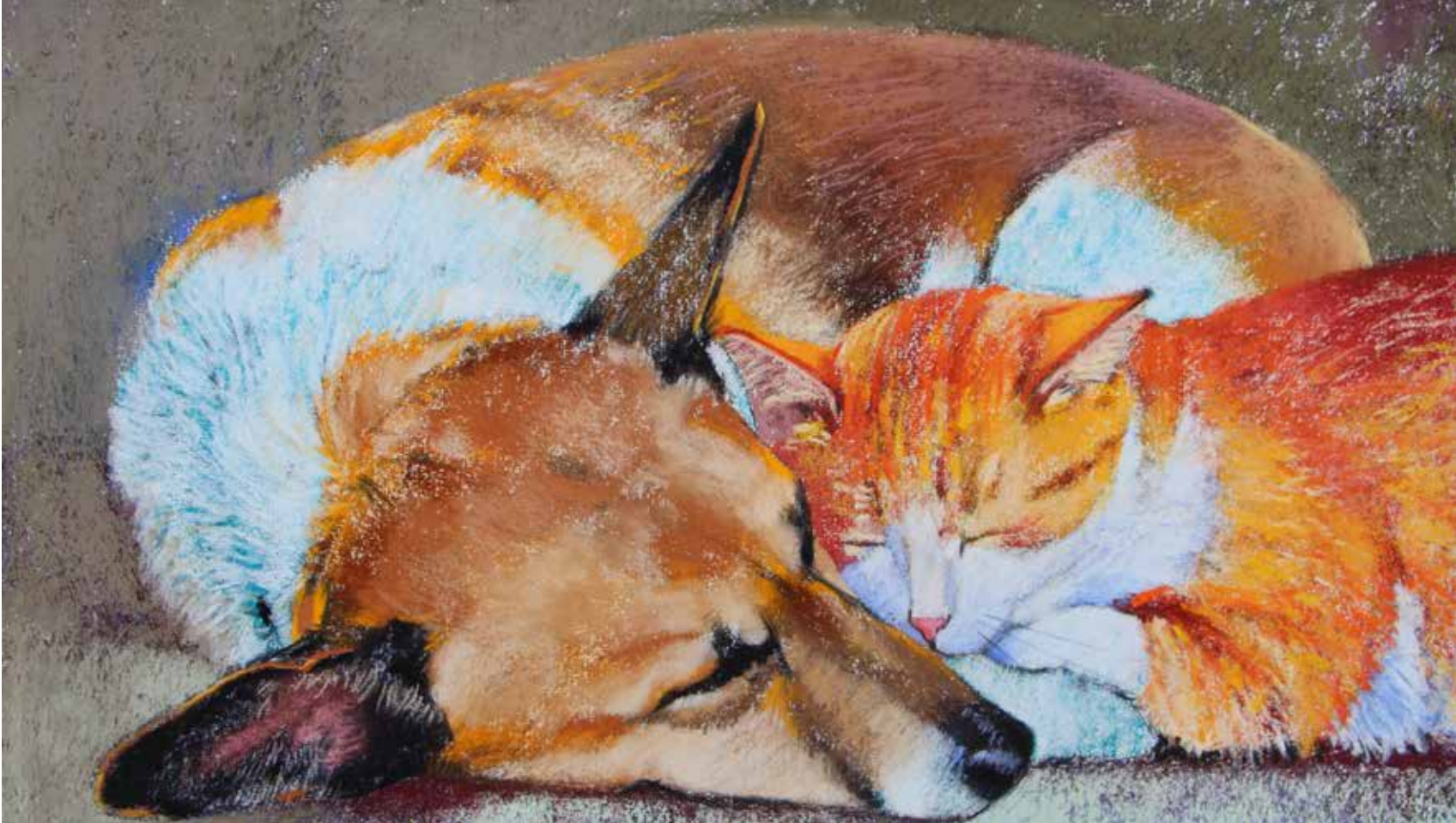
Loes Botman, Slapend verbonden , 2022, pastel op Hahnemühle Ingres papier, 37 x 56 cm

Omdat de ondertoon in de hond een andere kleur blauw heeft dan die in de poes, oogt het wit anders in beide dieren. De hele onderkant heb ik met een heel zacht krijtje getekend. Je ziet de paarse kleur er nog doorheen.