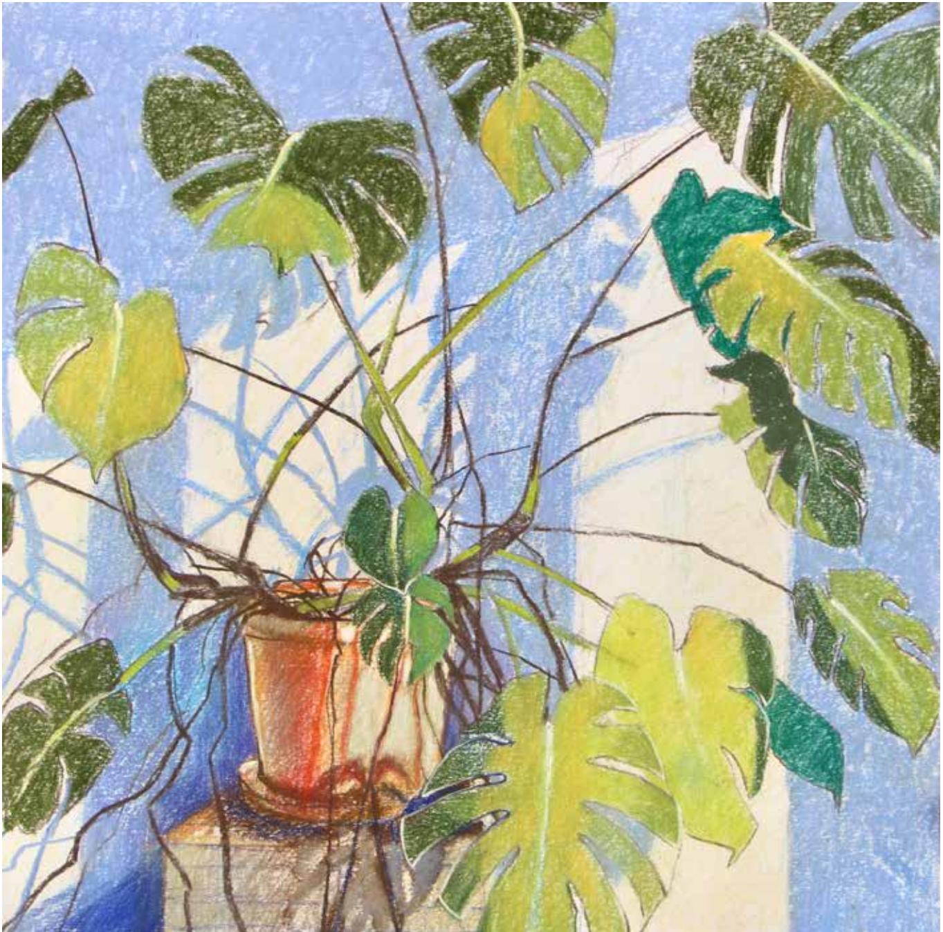
Loes Botman, Kamerplant in Lemmer , 2021, pastel op papier, 50 x 50 cm.

meest bewegende element, in de tekening wordt het een structuur waar je oog tot rust komt. Een complex thema als dit kan je tegenhouden in het tekenen ervan. Bouw het van achteren naar voren op, dan gaat het een stuk gemakkelijker. En wie maakt zich er druk om dat de schaduw en de bladeren niet precies kloppen? Voel je vrij en durf het aan!