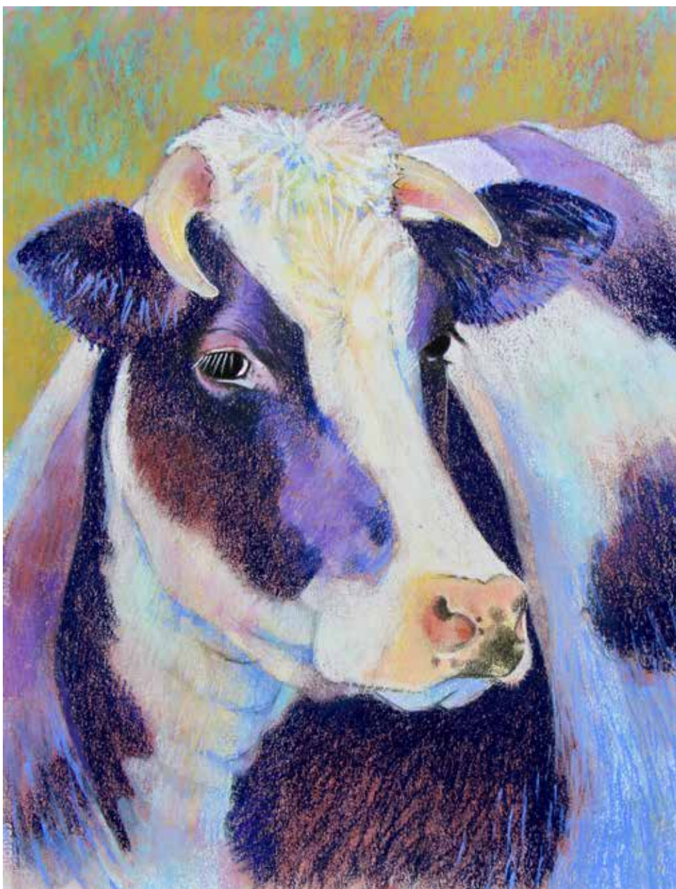
Loes Botman, Koeienkop , 2020, pastel op papier met pastelkrijt, 65 x 50 cm.