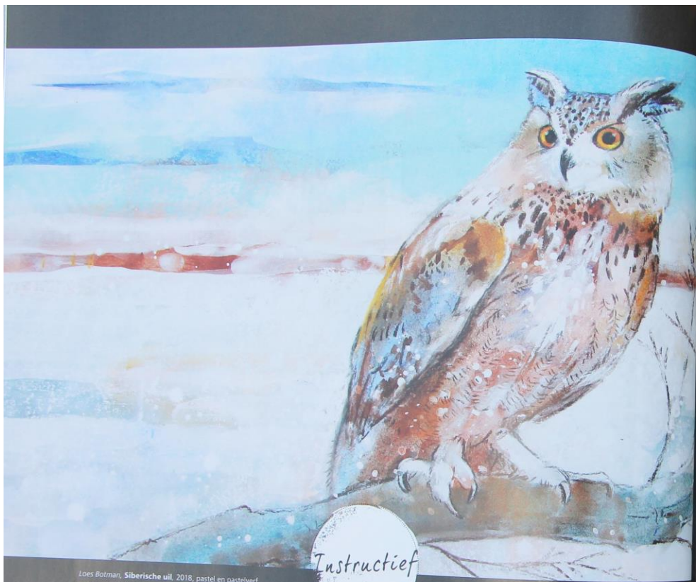
Loes Botman, Siberische uil , 2018, pastel en pastelverf op papier, 30 x 45 cm.