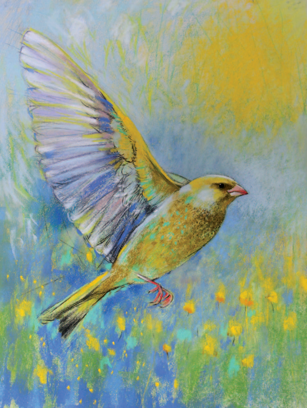
Blumenwiese, Himmel und Sonnenlicht verschwimmen in leuchtenden Pastellfarben, vor denen sich der Grünfink, hoch in die Lüfte schwingt.