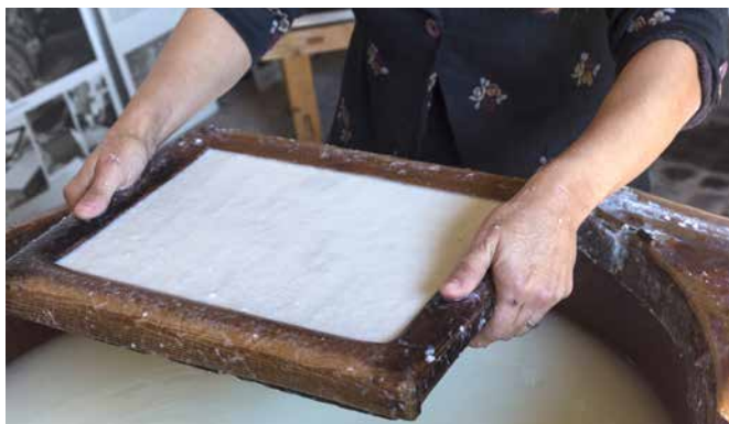
Handgeschept papier van katoenvezels.

Een ruw papier is geschikt voor stevige lijnen met houtskool, een glad en dicht papier is beter voor fijn potloodwerk en voor pen en inkt. Wie regelmatig correcties uitvoert door middel van raden, zal het meeste baat hebben bij een hard papier met oppervlakte-lijming ( tub sized ). Voor zachte tekenmiddelen zoals pastel, is een papier met een oppervlaktestructuur nodig. Een NOT-papier voldoet. 1 Er zijn speciale pastelpapieren in de handel, variërend van 'schuurpapier' tot bord met opgeplakte vezels.