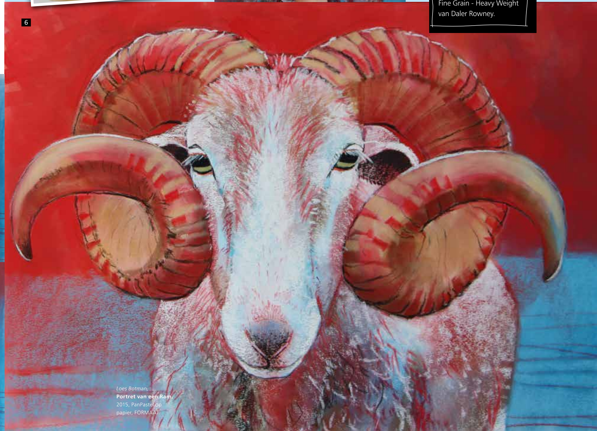
Loes Botman, Portret van een Ram, 2015, PanPastel op papier, FORMAAT.