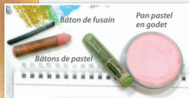
Bâton de fusain

Je précise peu à peu la forme du chat, en étirant du bleu depuis les contours vers l'intérieur et les zones sombres du pelage. Je pose du blanc sur les parties claires.